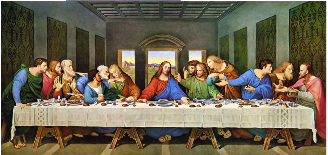
LEONARDO DA VINCI-CINA CEA DE TAINĂ